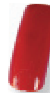
Cor 5 vermelho