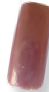
Cor 4 alperce