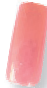
Cor 3 alperce/pérola