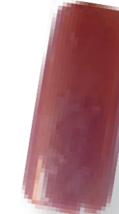
Cor 14 terracotta/pérola