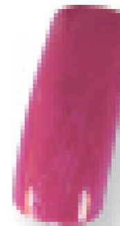
Cor 12 rosa/pérola