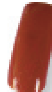
Cor 13 castanho/ferrugem