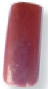
Cor 11 rosé velho