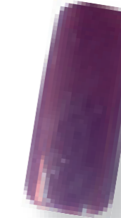
Cor 20 beringela