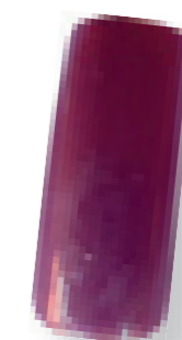
Cor 8 aubergine/pérola