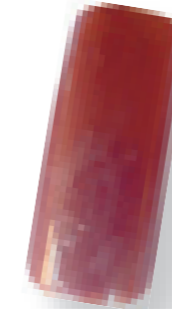
Cor 18 castanho cobre