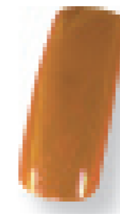
Cor 17 bronze brilho