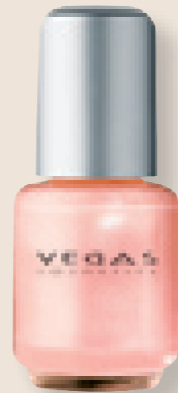
Cor 3 alperce/pérola