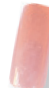
Cor 21 rosa brilho